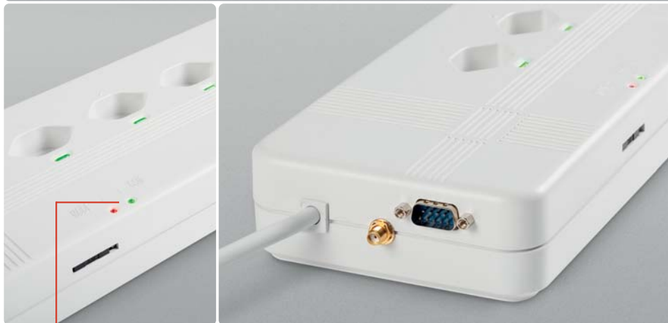
Variante: mobile[switch] professional